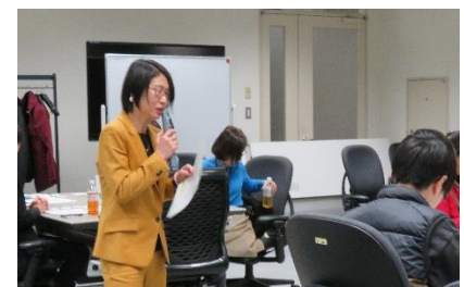
第2部（演習編）の様子