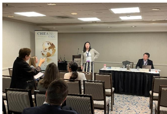
発表後の質疑応答