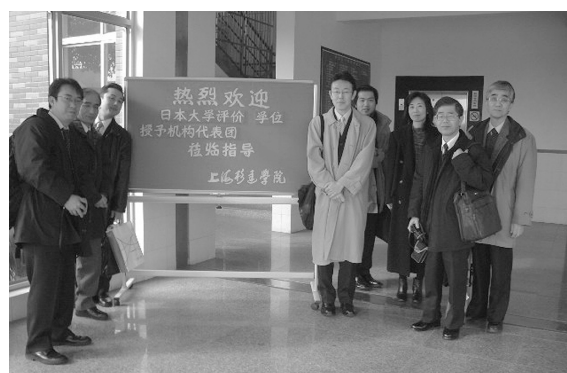
上海杉達大学への訪問調査（2005年2月）

以上の2点は、各国において共通に解決策が模索されている課題だといってよい。歴史と伝統に培われた「大学」と「学位」の特質を尊重しながら、時代の要求に応えるために、堅実な研究に支えられた政策が求められている。