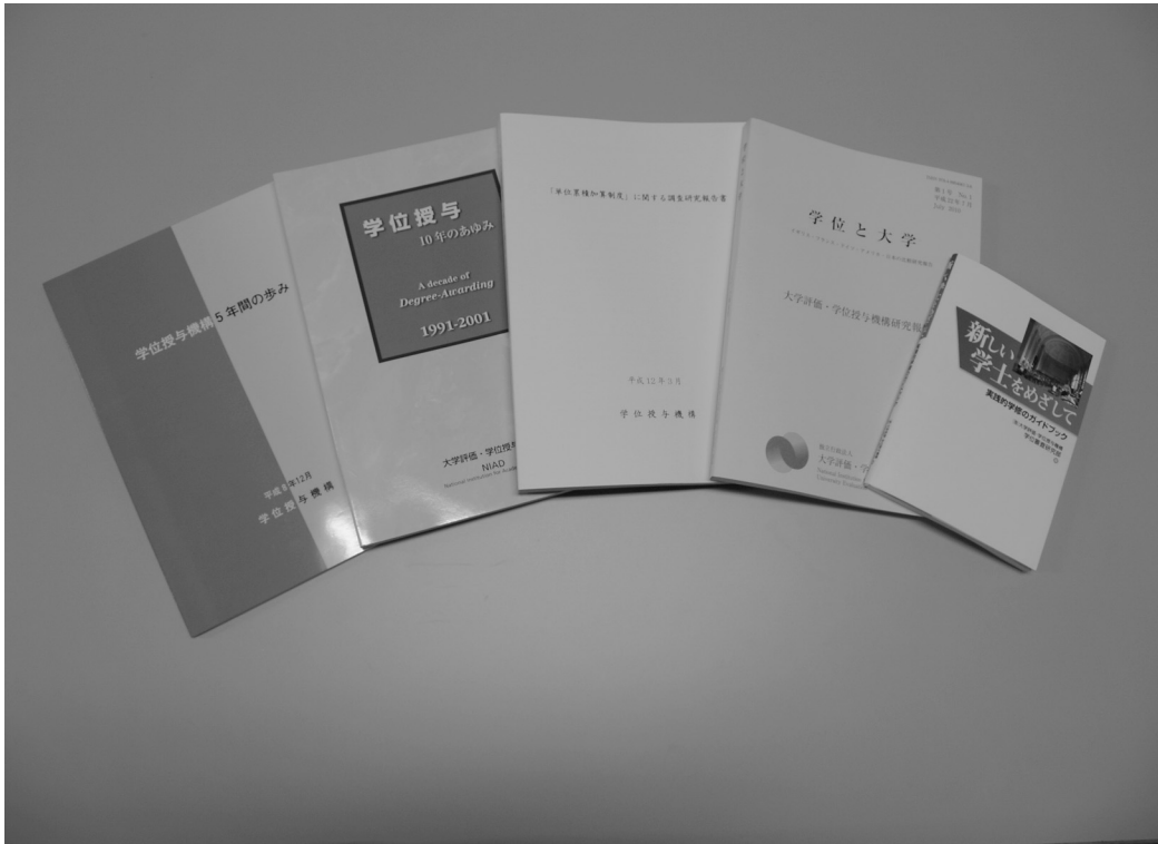
『学位授与機構 5年間の歩み』、『学位授与 10年のあゆみ』、『単位累積加算制度に関する調査研究報告書』、『学位と大学』、『新しい学士をめざして—実践的学修のガイドブック—』