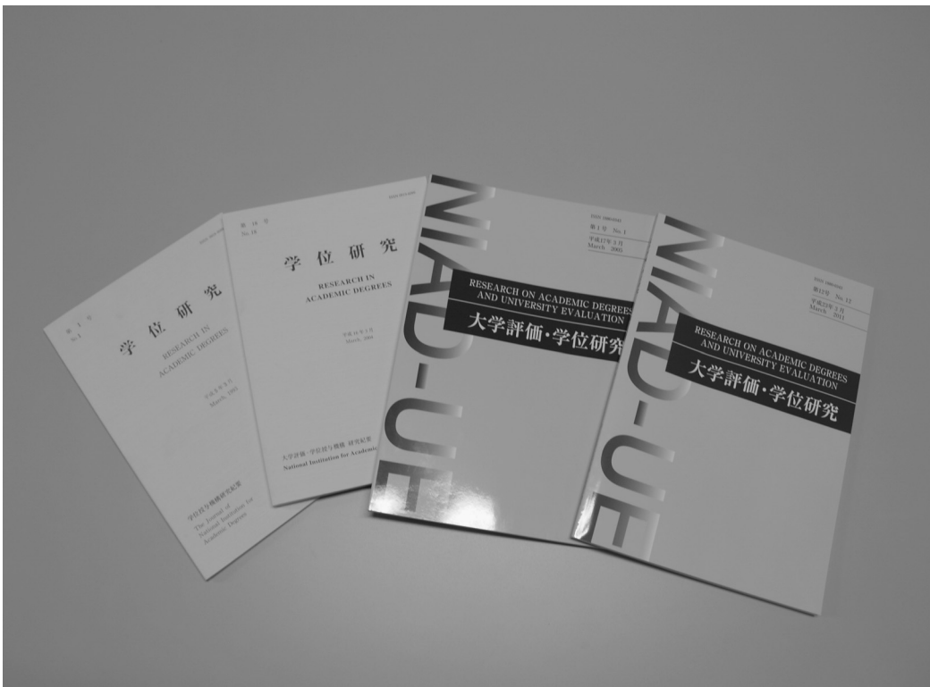
『学位研究, No.1, No.18』、『大学評価・学位研究, No.1, No.12』