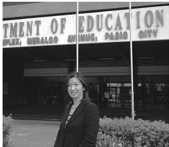
フィリピン共和国教育省（2008年撮影）

ままその制度を維持することとなる。そして いわば機構の調査研究も、ある種さしあつ たまま次なる調査研究課題を模索しながらさ らなる10年を経ることになる。次章は、この、 機構創設以来の課題であった単位累積加算制 度の実現に向けた調査研究という大命題の喪 失の経緯から説き起こすことにしたい。