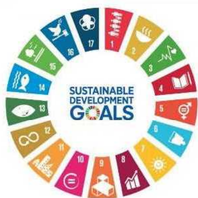
SDG 4 Quality Education