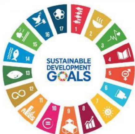
持続可能な開発目標 4 質の高い教育