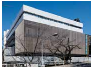
中央診療棟（千葉大学）