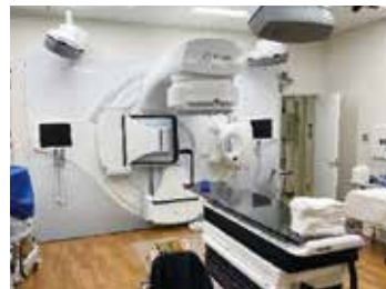
放射線治療システム一式（金沢大学）