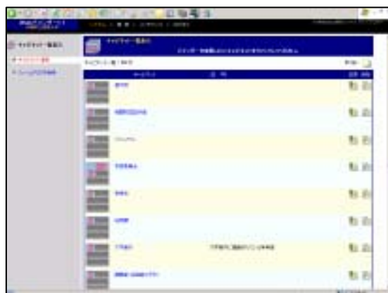
資料 11- G Web バインダー