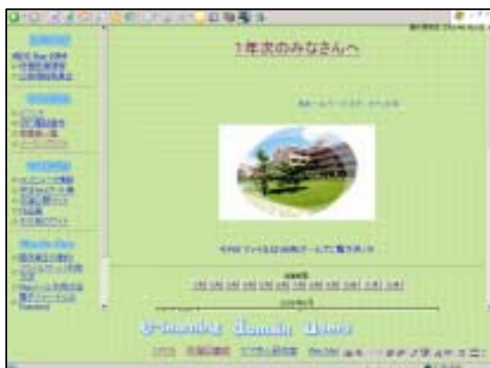
資料 11- F e-learning domain users (EDU)の初期画面

大学の目的、計画、活動状況に関するデータや情報は学内のサーバーに蓄積されており、大学の構成員は必要に応じて、大学ホームページからアクセスできるようになっている(資料 11- F)。さらに、教授会と研究科委員会の議事録は Web バインダーに蓄積され、各種供覧文書等とともに、教職員全員が自由にアクセスし閲覧できる(資料 11- G)。本学の月間計画や週間計画は、メールで全教職員に送られ、学内外の大学関連行事や、学内委員会等の情報を共有している(資料 11- H)。