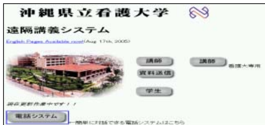
資料5-R 遠隔講義システム http://www.okinawa-nurse.jp/

現在在籍中の院生の7割は社会人学生であることから、院生の便宜を考慮して授業開始時刻を17時40分としている。また、土日や祝祭日にも授業を行い、フレキシブルな授業時間の設定も行われている。さらに、大学院開設時より、離島や遠隔地の院生に配慮し、講義の一部を遠隔講義システムによって行なう試みを実施している(資料5-R-5-48)。